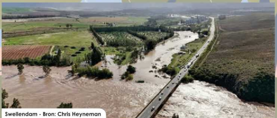
Swellendam