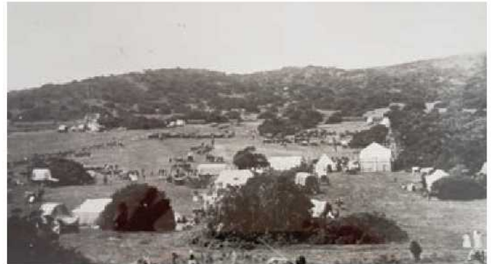
Community members and farmers gathered in 1904 to enjoy the festivities of the Bathurst Agricultural Show.