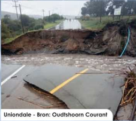
Uniondale - Bron: Oudtshoorn Courant

Ten spyte van waarskuwings deur die Suid-Afrikaanse Weerdiens net voor 7 Mei, is die Wes-Kaap, Oos-Kaap en ander dele van die land deur swaar reën en stormsterk winde getref. Die nagevolge van hierdie weertoestande het tot oorstromings en windskade in baie dele van SSK se bedieningsgebied gelei.