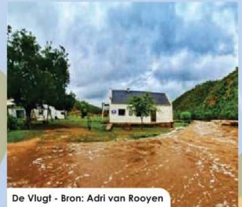
De Vlugt