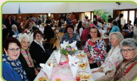
Vrolik, feestelik en vroulik!