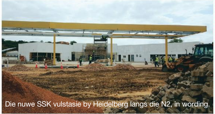
Die nuwe SSK vulstasie by Heidelberg langs die N2, in wording.