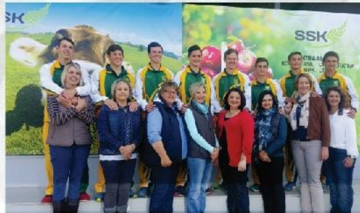
Die Oakdale Touthrekspan en hul grootste ondersteuners.