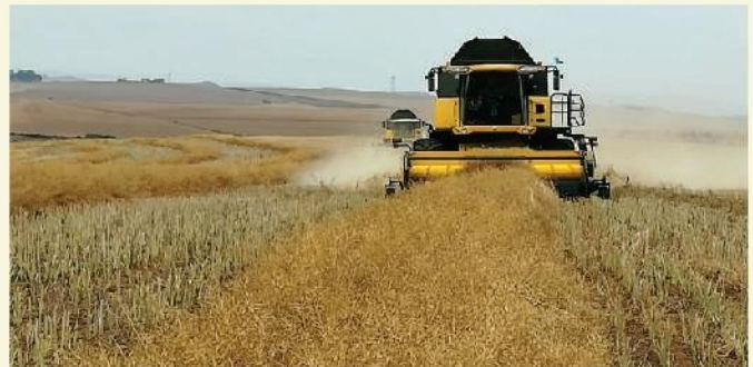
Canola word gedors met New Holland CR 9080 stropers van Piet en Lafras Uys