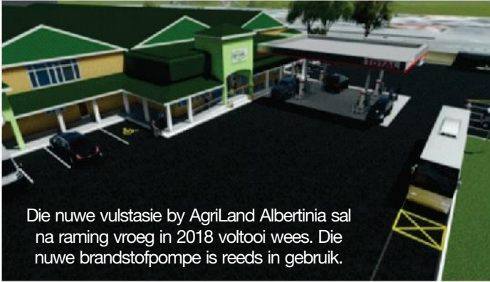
Die nuwe vulstasie by AgriLand Albertinia sal na raming vroeg in 2018 voltooi wees. Die nuwe brandstofpompe is reeds in gebruik.