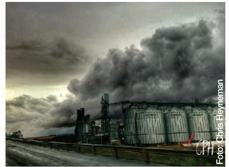
Deurdringende reën het middel November in Swellendam geval.